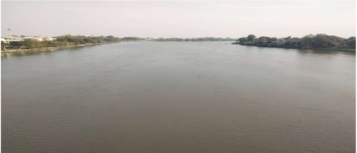
รูปตัดขวางลำน้ำ ปีนี้ 2568 สถานี P.7A แม่น้ำปิง อ.เมือง จ.กำแพงเพชร